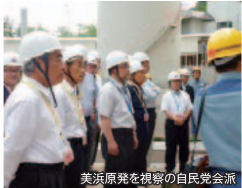
美浜原発を視察の自民党会派