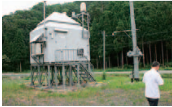
今津小、マキノ町、余呉町(写真) 西浅井町は会派で視察